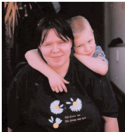
Das Sofa ist der Lieblingsplatz der Mutter, hier sitzt sie mit Nachbarinnen beim Kaffee

„Die Kinder sind sauber angezogen. Die Kinder kriegen ihre Süßigkeiten. Wir fahren mit ihnen in den Zoo und auf den Rummel. Die Kinder wissen, dass wir sie lieb haben.“