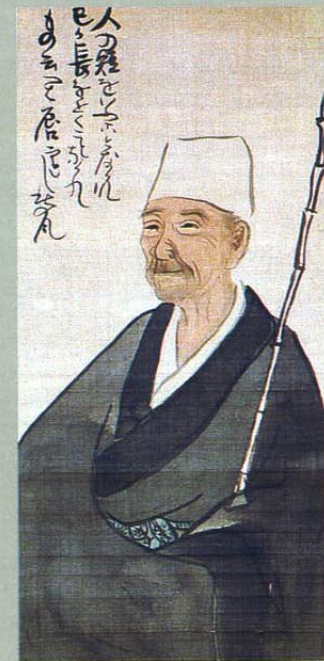
Monatelang reist Matsuo Basho durchs Land – auf der Suche nach Momenten, die es festzuhalten lohnt

Während seiner Wanderung verarbeitet er Beobachtungen und Erfahrungen zu Gedichten: das hübsche Aussehen eines Bauernmädchens; ein nistendes Fischadlerpaar; Einsamkeit und Herbststimmung. Seine Themen scheinen alltäglich. Alles passt in drei Zeilen, lässt sich fassen in 17 Silben. Und doch sind seine