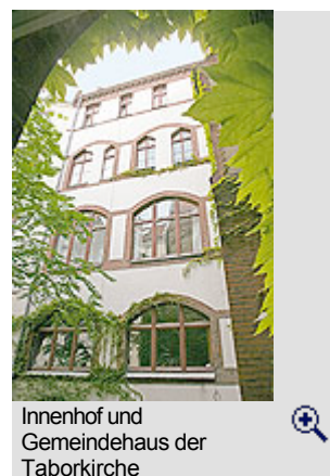
Innenhof und Gemeindehaus der Taborkirche