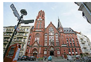
Die Taborkirche in Berlin-Kreuzberg, rechts und links eingerahmt von Wohnhäusern