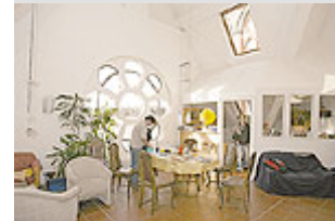
Hauptattraktionen der Wohnung sind der Blick von der Terrasse und ein 60 Quadratmeter großer Gemeinschaftsraum