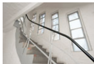
Industriecharme im besten Sinne: das Treppenhaus